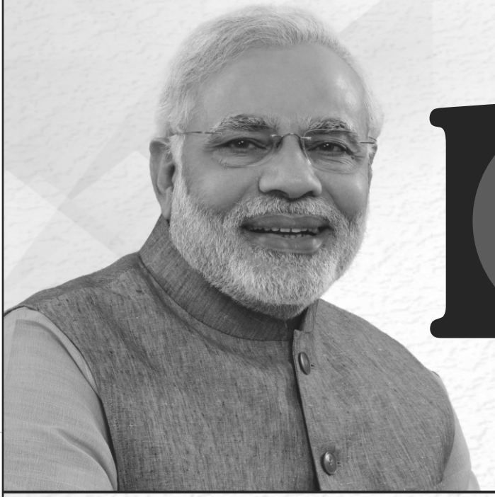
श्री नरेन्द्र मोदी माननीय, प्रधानमंत्री